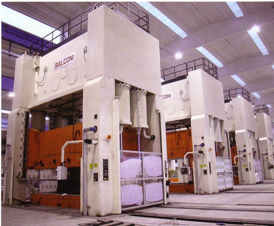
Balconi-Pressen mit Werkzeugwechselsystemen im Werk eines Automobilzulieferers.

Zur Euroblech in Hannover wurde ein Stanzautomat vom Modell 100 DC4 zum Stanzen von Lamellen für die Heiz-/Klima-Industrie ausgestellt. Die 4-Säulen-Pressen hat eine Presskraft von 100 t, einen Tisch von 1820 mm x 840 mm und eine verstellbare Geschwindigkeit bis 350 Hübe pro Minute. Ein hydraulisches Schnellöffnungssystem ermöglicht die Inspektion des Werkzeuges, ohne die Einstellungen der Maschine verändern zu müssen. Dieses System funktioniert auch zum Lösen der festgefahrenen Maschine. Alle Pressenfunktionen und Parameter sowie die Produktionsüberwachung und Diagnose werden durch eine S7-300-SPS mit Touchscreen-Panel betrieben. Auch diese Maschine ist wie alle Balconi-Pressen mit vier Plunger-Systemen ausgerüstet.